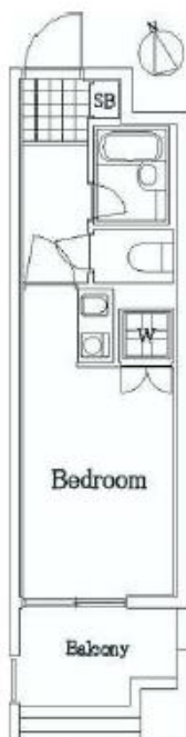
図面が現状と異なる場合は現状優先とします。 更新料:新賃料の1.5ヶ月分