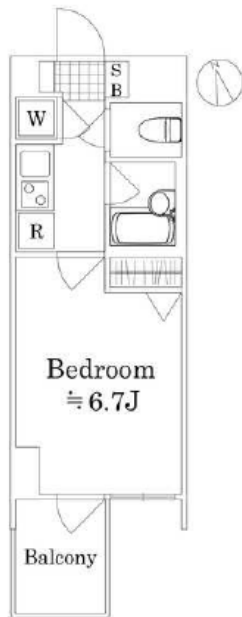
図面が現状と異なる場合は現状優先とします。 更新料:新賃料の1.5ヶ月分